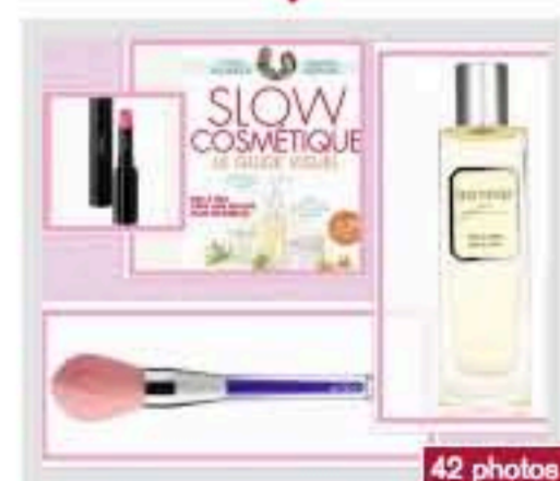
40 nouveautés beauté testées et approuvées par la rédac' !