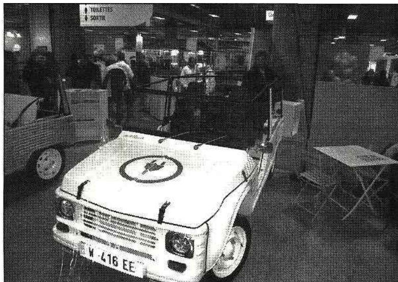
Le département de l'Ardèche était également représenté par Méhari Loisirs (photo) du Pouzin, Ardelaine de Saint Pierreville, et N°7 de Roiffieux.

* Les 17 entreprises: Bulles et Formules, Entreaute, Archer, Escarcelle, Les P'tites Cousines, Laboratoires Bimont , Le Tiroir au Chocolat, Les Créa de Flo, Bijoux Ose, Milémil, Nougat Chabert et Guillot, Aimelys, Insoft, Manufêtes, Florence Faugier, Odyz, Cosmétique Paysanne.