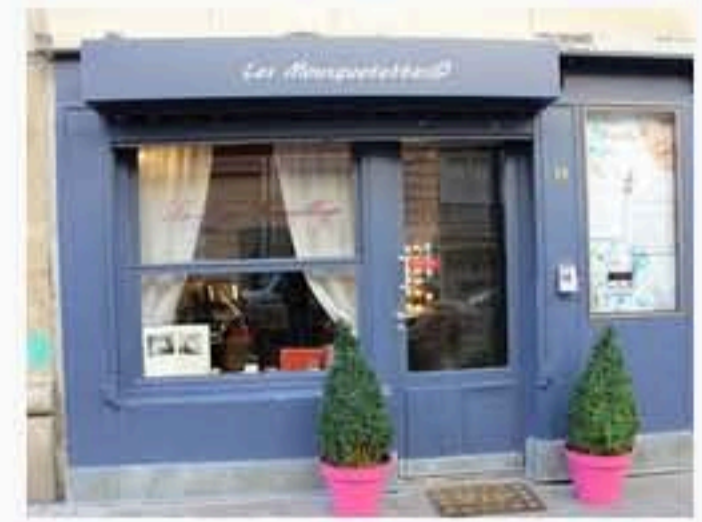
La Loge Maquillage de Georges Demichelis à Paris