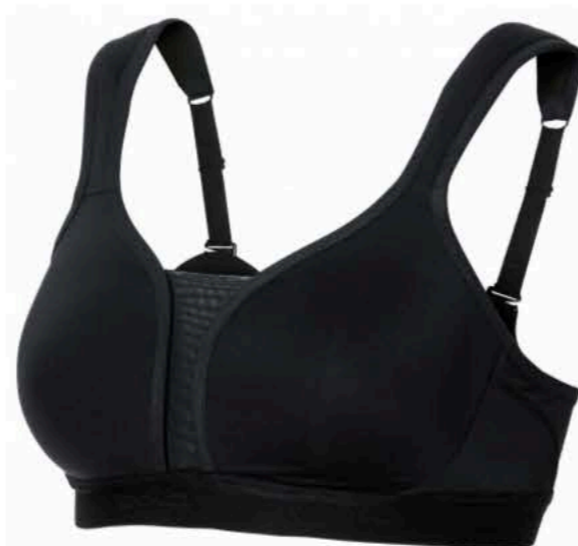
Brassière Medium Padded

Crée en 1946, Odlo est une marque de sport Norvégienne adaptée à tous les climats et pour tous les sportifs. Ski, randonnée, vélo, course à pied... l'enseigne propose des vêtements et sous vêtements pour chaque activité. Mais aussi de magnifiques brassières et soutien-gorges de sport pour les femmes. Disponibles dans différents modèles, tailles et coloris, les brassières Odlo permettent de minimiser les mouvements de la poitrine et donc d'éviter les blessures mais surtout l'affaissement des seins. C'est pourquoi la marque propose 3 types de soutien-gorge pour 3 niveaux d'intensité : faibles impacts, impacts modérés et impacts forts.