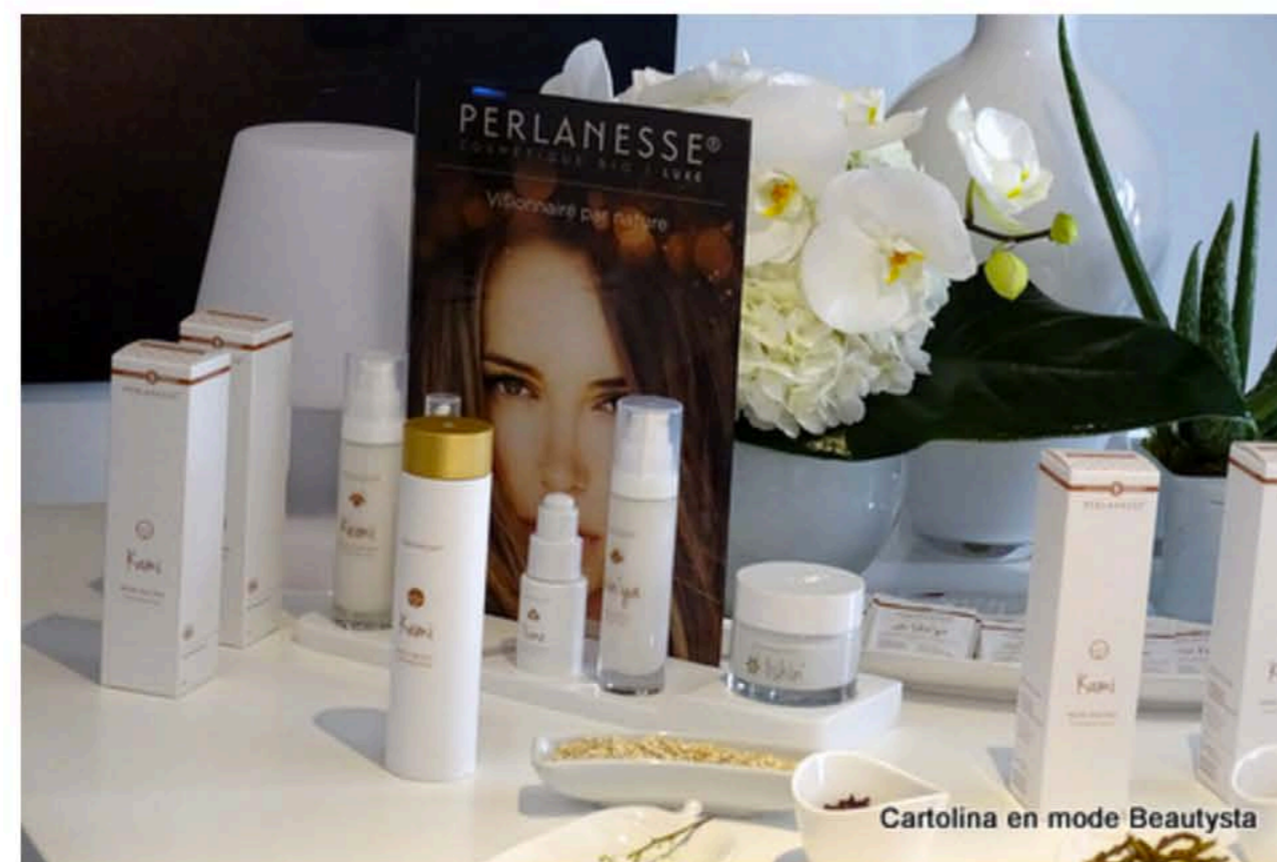
Cartolina en mode Beautysta

Perlansesse c'est une marque de cosmétiques bio de luxe à base de lait d'ânesse créée par les laboratoires Bimont.