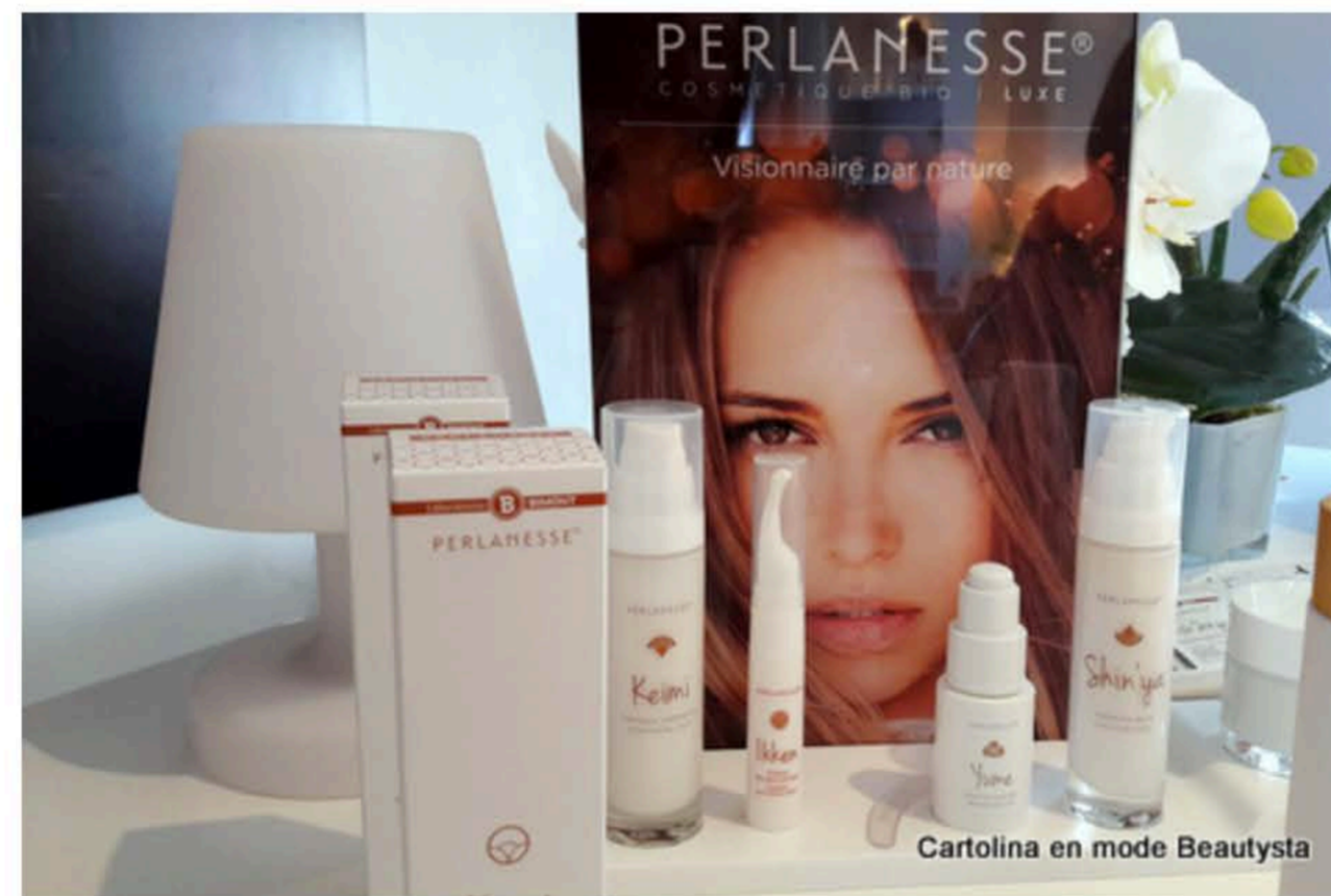
Cartolina en mode Beautysta