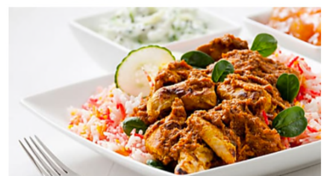
Poulet à l'indienne